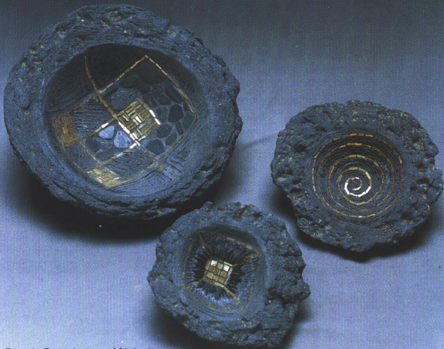
Pascale Beauchamps, Météorites .